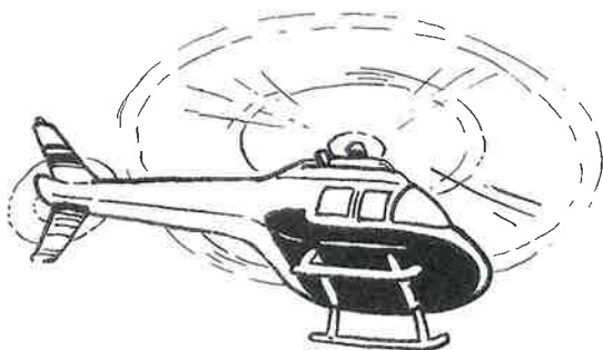
En helikopter i frøperspektiv

Her er tre forskellige motiver fra Grønland set i hvert sit perspektiv. Beskriv motiv og perspektiv under hvert billede. Vi er begyndt for dig.